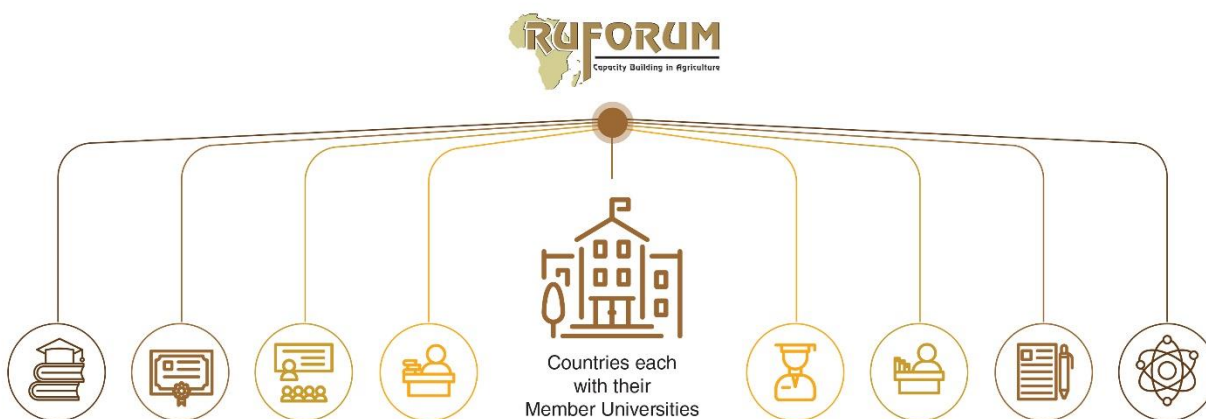
Figure 1. RUFORUM en tant qu'organisation faîtière dont l'agenda dérive de ses membres.

Le Forum Régional des Universités pour le Renforcement des Capacités en Agriculture (RUFORUM) est une organisation panafricaine regroupant principalement des universités d'enseignement et de recherche agricoles en Afrique. RUFORUM a été fondé par les Recteurs en 2004 et a 163 universités membres dans 40 pays d'Afrique pour plus de détails (visitez www.ruforum.org ). RUFORUM considère « Des universités dynamiques et transformatrices qui catalysent un développement agricole durable et inclusif pour nourrir et créer de la prospérité pour l'Afrique » comme un mécanisme majeur pour transformer et faire croître l'économie Africaine et le développement mondial en général. Depuis sa création, les opérations de RUFORUM reposent sur la vision et la mission de ses membres. Dans cette mesure, RUFORUM est créé comme une organisation faîtière qui tire son programme opérationnel de ses membres au niveau national (Figure 1).